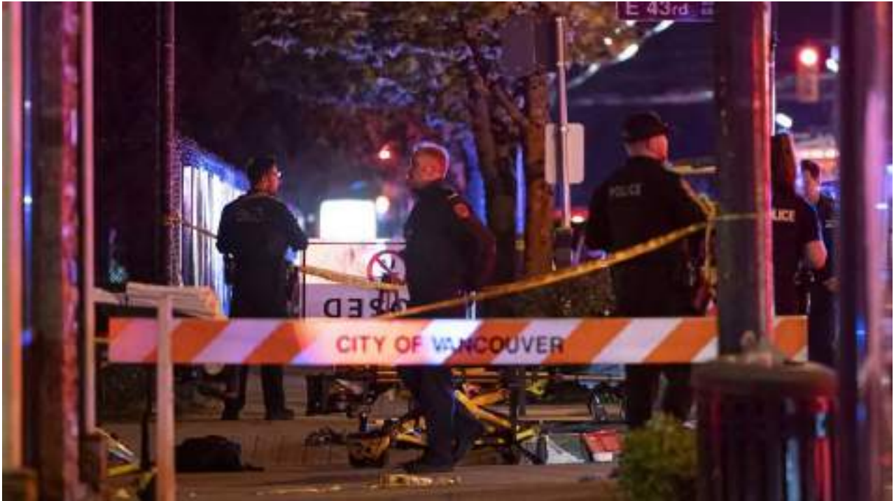
La Policía de Vancouver, en el lugar del atropello.

Así, las elecciones del 28 de abril de 2025 se presentaron como una oportunidad para elegir entre proyectos de nación distintos, en un contexto internacional volátil y una economía interna aún marcada por el legado de Trudeau. A esto se sumó un clima coyuntural sombrío, tras un atropello masivo ocurrido el sábado previo al cierre de campaña en la ciudad de Vancouver, en el que murieron 11 personas.