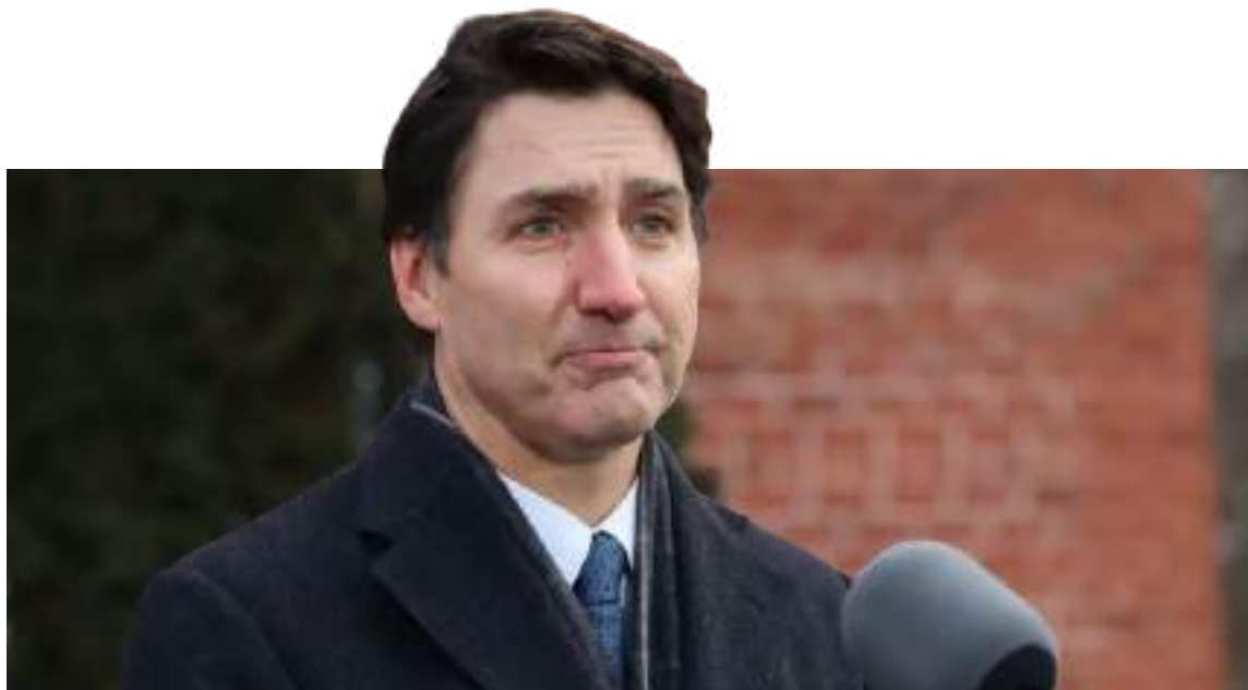
Justin Trudeau renunciando como primer ministro de Canadá.

El pasado 6 de enero de 2025, Trudeau anunció su dimisión como líder del Partido Liberal y, por ende, como primer ministro. Su salida fue consecuencia de las crecientes presiones internas, tanto de su partido como de la opinión pública, que exigían un relevo en el liderazgo para afrontar los desafíos actuales.