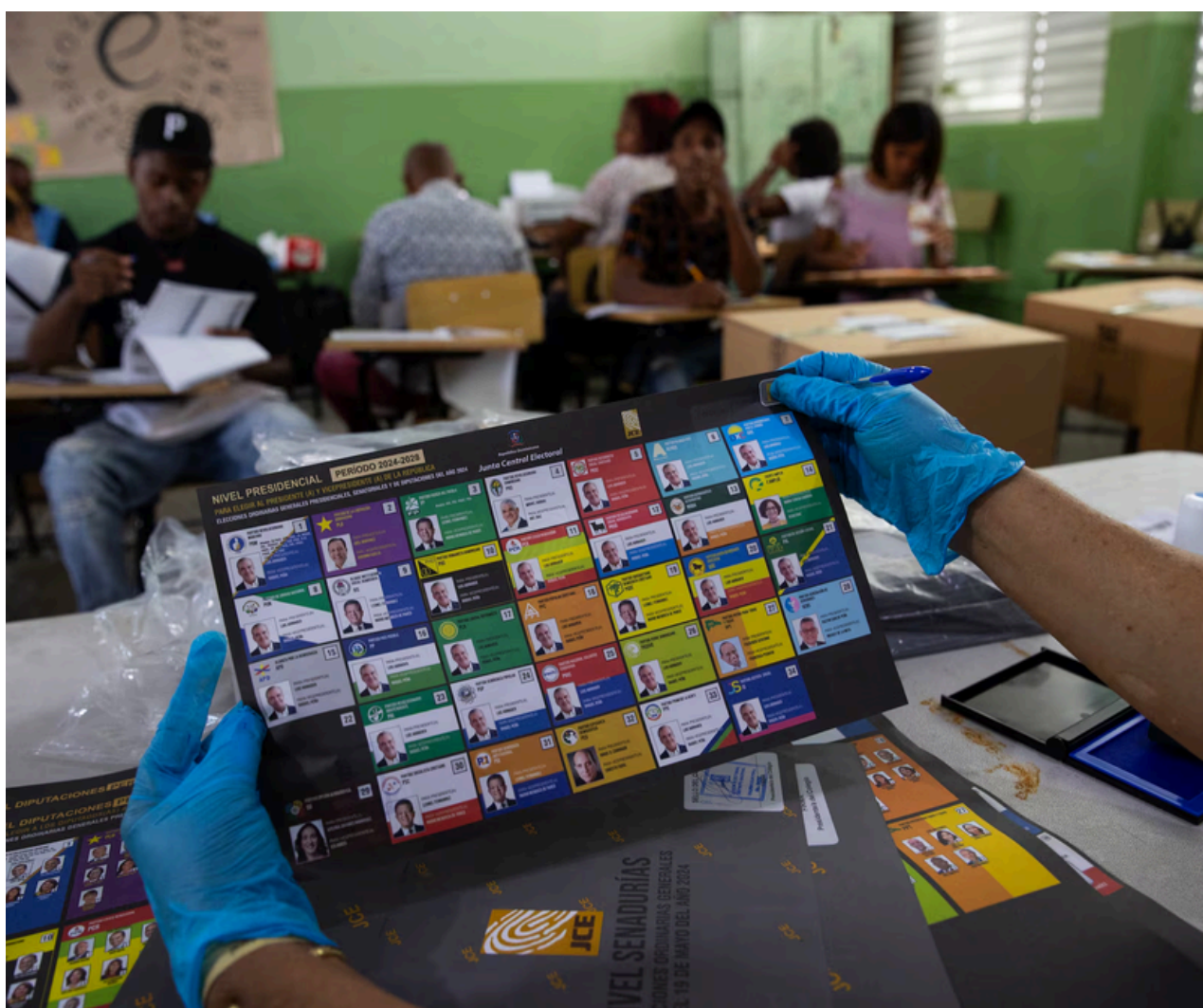
Un funcionario sostiene una papeleta electoral en la escuela República de Chile, que es utilizada como centro de votación.

Este año se puso especial énfasis en la transparencia y seguridad del proceso. Las elecciones de 2024 fueron las primeras bajo la nueva Ley Orgánica de Régimen Electoral, que fue promulgada en 2023. Esta ley establece que los crímenes y delitos electorales serán conocidos por los tribunales penales ordinarios y detalla las competencias de la Procuraduría Especializada en materia electoral.