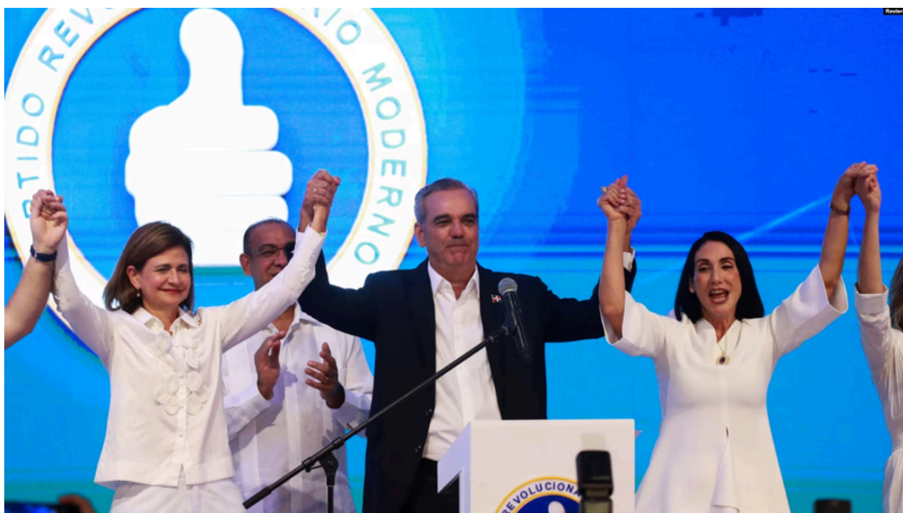
El presidente de República Dominicana y candidato presidencial Luis Abinader se dirige a sus seguidores tras los resultados preliminares de las elecciones presidenciales, en Santo Domingo, República Dominicana.

Tras el contundente resultado en los comicios, el presidente reelecto Abinader expresó que “la República Dominicana ha escrito una página de avance democrático, y los resultados hablan por sí solos” , tras haberse desarrollado los comicios con normalidad. Añadió que “el pueblo ha hablado con claridad, los dominicanos y dominicanas quieren seguir profundizando el cambio, lo demuestra el hecho que hemos obtenido un mejor resultado electoral respecto al obtenido en el 2020, con más apoyo popular y más votos”, agradeciendo a sus votantes. El mandatario creyó que la ciudadanía supo reconocer la labor realizada en los últimos 4 años. “Lo mejor para la República Dominicana está por venir (...) el país ha cambiado y ha cambiado para siempre. Estas elecciones también fijarán un punto de inflexión en nuestra institucionalidad, porque garantizaré al país promover una reforma constitucional”. Esto último vaticina cómo será el porvenir del país centroamericano en cuanto a su constitución. Finalmente, sentenció que ésta victoria electoral sería su última, “porque respetaré los límites en la constitución en los términos de la reelección. No volveré a ser candidato”, esto plantea una cierta crítica frente al accionar de los últimos presidentes dominicanos que pretendían mantenerse en el poder por más tiempo.