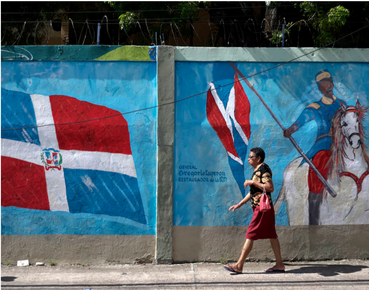
Una mujer camina cerca de un centro de votación en la capital.

Si bien el último gobierno dominicano ha logrado una buena gestión económica, el manejo de la popularidad y un claro liderazgo contra la corrupción, actualmente la sociedad dominicana engloba una gran serie de demandas vinculadas principalmente a la seguridad nacional, el alto costo de vida, el desempleo y la corrupción. Situación que se ha manifestado claramente en el amplio crecimiento que se ha dado en el padrón electoral para estas elecciones pasadas, lo que explica también la fortaleza de las peticiones ciudadanas actuales y la esperanza de la ciudadanía respecto a este período electoral.