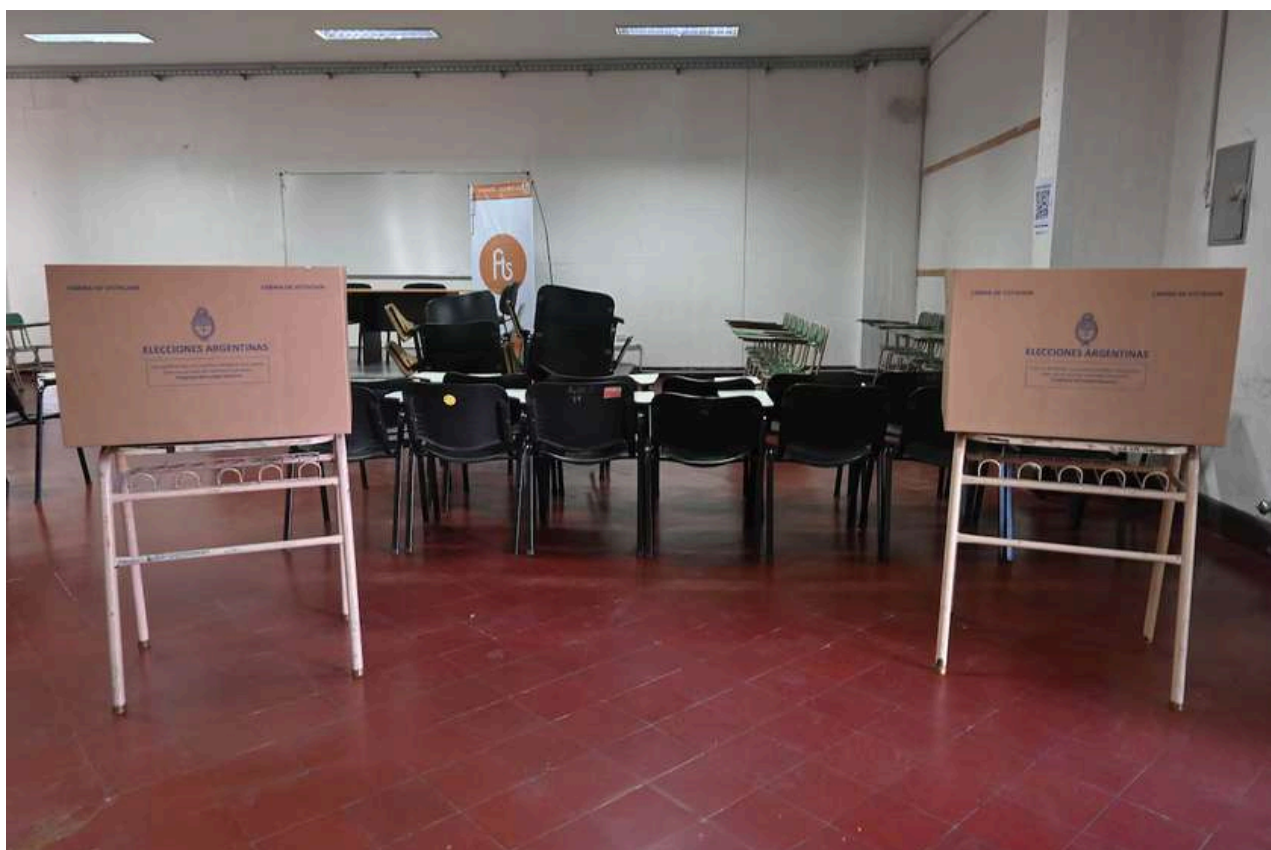
Uno de los tantos centros de votación en La Plata.

En cuanto a las perspectivas, el escenario fue complejo. En los últimos meses se registraron escándalos de corrupción que afectaron la imagen del oficialismo y podrían explicar parcialmente la derrota sufrida en la elección provincial de Buenos Aires en septiembre del 2025. Dado que el discurso de gobierno se centra en la austeridad y la ética pública, tales episodios resultan especialmente dañinos si el electorado percibe una contradicción entre el mensaje y las prácticas de los funcionarios.