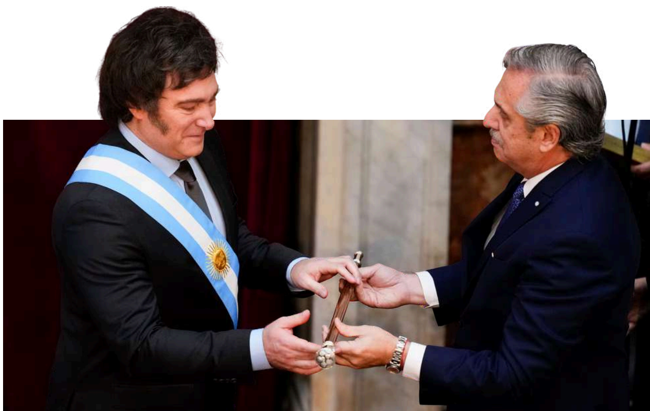
Javier Milei recibe el bastón presidencial de manos de Alberto Fernández, expresidente de Argentina.

Javier Milei asumió la presidencia en diciembre de 2023, tras irrumpir como figura outsider con su partido La Libertad Avanza (LLA). Su gobierno se caracteriza por una agenda de ajuste económico, reducción del gasto público, desregulación de la economía y disminución del rol del Estado.