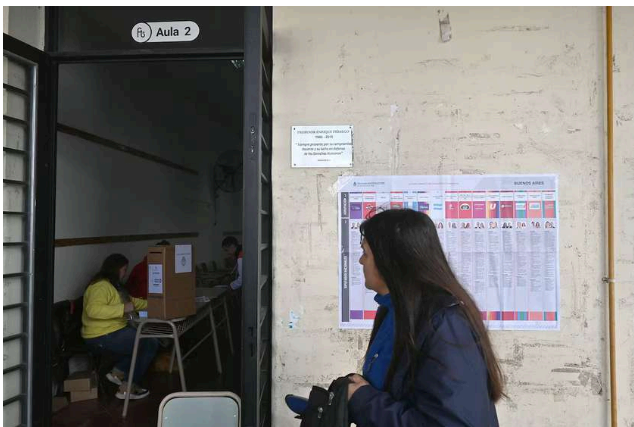
Una mujer espera para votar en La Plata, Argentina.

En este contexto, las elecciones legislativas de 2025 no solo definieron la composición del Congreso, sino que también actuaron como un termómetro del humor social y político del país. Los resultados reflejarían el nivel de apoyo ciudadano al drástico cambio de rumbo propuesto por el gobierno de Milei, en un escenario atravesado por el impacto del ajuste económico y recientes escándalos de corrupción. El veredicto de las urnas, por tanto, estaba destinado a moldear el futuro político inmediato de Argentina, determinando la capacidad del oficialismo para profundizar su "revolución liberal" o forzando un escenario de mayor negociación y equilibrio de poder.