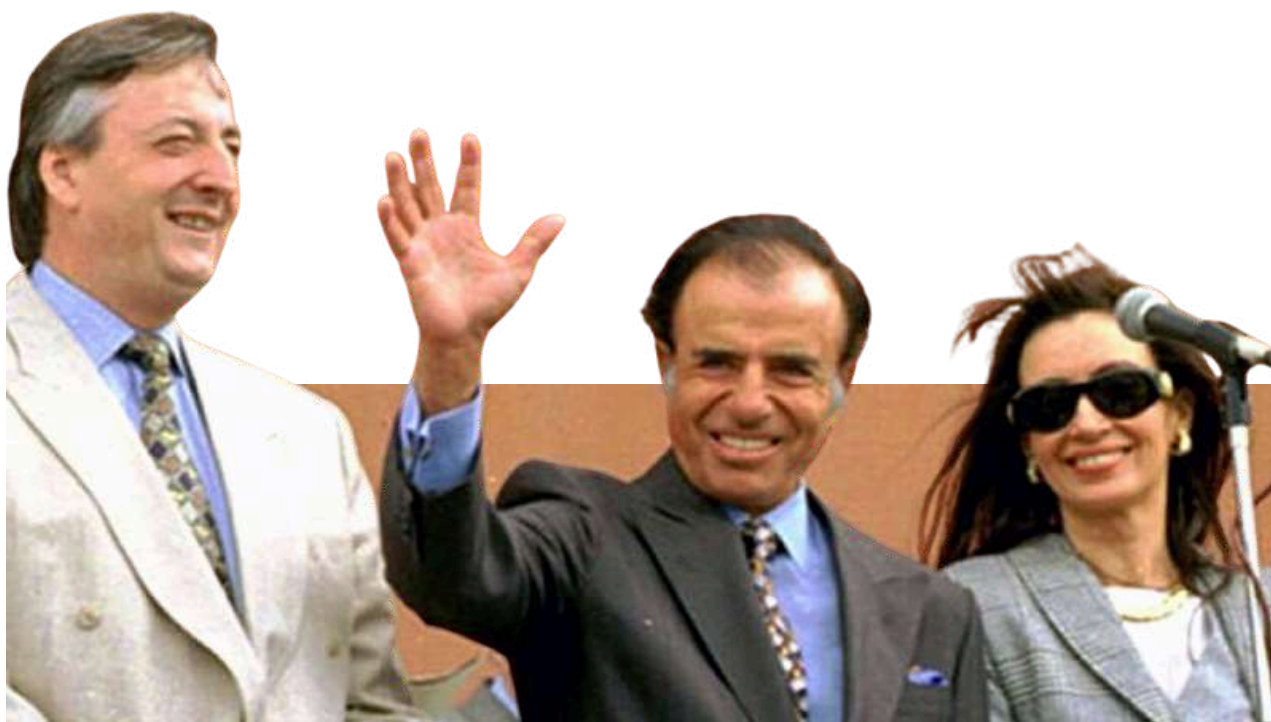
Carlos Menem junto a Néstor Kirchner y Cristina Fernández de Kirchner.

Entre 1989 y 1999, Carlos Menem logró mantenerse en el poder, fundamentalmente gracias al control de la inflación mediante su política de convertibilidad (el “ currency peg ” entre el peso argentino y el dólar estadounidense). Entre 2003 y 2015, Néstor Kirchner y Cristina Fernández de Kirchner también consiguieron prolongar su permanencia en el gobierno, apoyados en políticas de redistribución económica y expansión del Estado de bienestar. En ambos casos, sus modelos fueron cuestionados por su sostenibilidad económica y por las denuncias de corrupción.