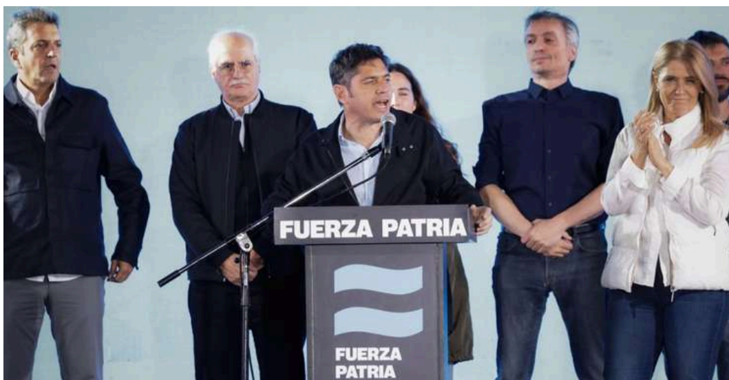
Axel Kicillof dando un discurso luego de los resultados.

Por su parte, el gobernador de la Provincia de Buenos Aires, Axel Kicillof, desde el búnker de Fuerza Patria en la ciudad de La Plata, expresó: "Fueron resultados muy ajustados, con una mínima diferencia del 0,5% en nuestra contra, pero que nos han permitido renovar los 15 diputados y sumar uno más".