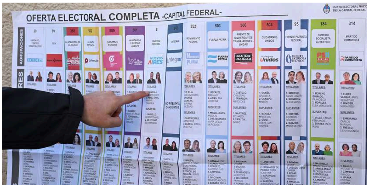
La Boleta Única de Papel.

El resultado de estos comicios era fundamental para la gobernabilidad del presidente, quien hasta ese momento había carecido de mayoría propia en ambas cámaras. Esta debilidad parlamentaria lo obligó a negociar con fuerzas opositoras o a recurrir a decretos de necesidad y urgencia para impulsar sus iniciativas, generando constantes tensiones institucionales. Por lo tanto, obtener un resultado favorable era crucial para fortalecer su mandato, consolidar su proyecto político y asegurar la aprobación de reformas estructurales pendientes en materia laboral, fiscal y de privatizaciones. Una derrota, en cambio, amenazaba con debilitar su autoridad y limitar su margen de maniobra para los dos últimos años de su presidencia.