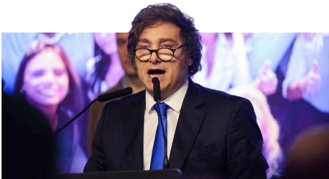
Javier Milei daba un discurso tras conocer los primeros resultados de las legislativas argentinas.

En su discurso tras el triunfo electoral, el presidente Javier Milei destacó: "Hoy ha sido un día histórico. El pueblo argentino dejó atrás la decadencia y optó por el progreso. Hoy pasamos el punto bisagra. Hoy comienza la construcción de la Argentina grande".