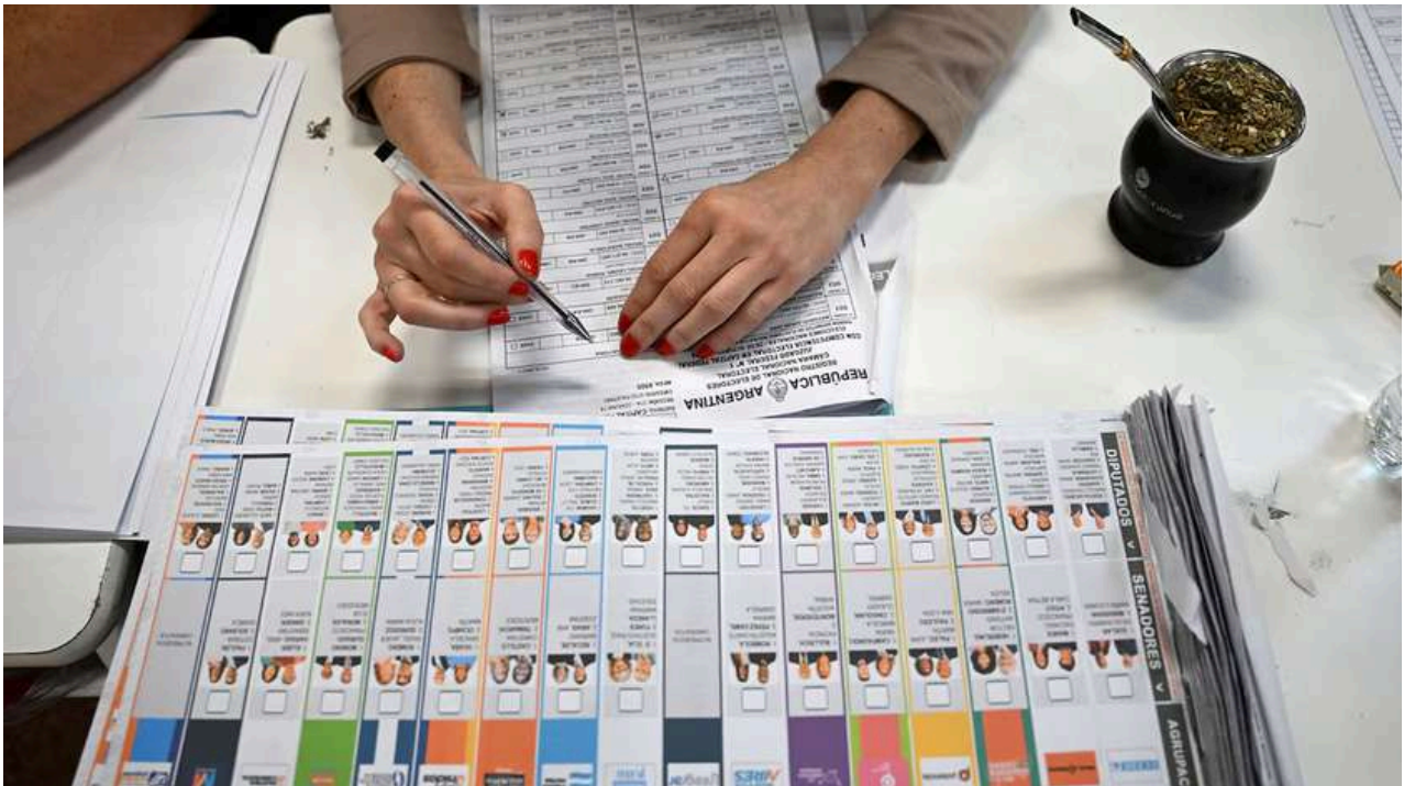
La Boleta Única de Papel y el padrón electoral.

La Boleta Única en Papel consiste en un documento que incluye en una misma hoja todos los candidatos, categorías de cargos y partidos políticos. Está dividida en filas horizontales por categoría de cargo y columnas verticales por agrupación política. Al lado de cada cargo dispone de un casillero en blanco, donde el elector marca su opción para cada categoría.