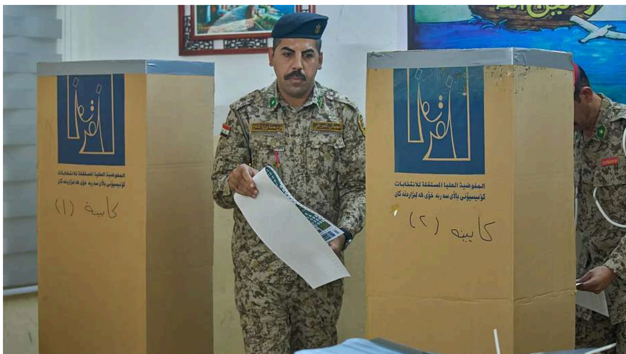
Un soldado del ejército iraquí emite su voto.

competencia democrática. Esto provocó que el clima previo a las elecciones estuviera marcado por el desencanto y la desconfianza: la mayoría de los ciudadanos percibía que los cambios eran meramente cosméticos y que los verdaderos centros de poder permanecían intactos.