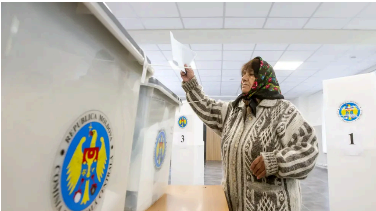
Una mujer emite su voto en un colegio electoral en Chisinau, Moldavia.

Los resultados de la jornada electoral no solo reconfiguraron el parlamento moldavo, sino que también generaron una serie de reacciones a nivel nacional e internacional. El veredicto de las urnas no solo legitima a los nuevos representantes, sino que también envía un claro mensaje sobre las aspiraciones y preocupaciones del pueblo moldavo en un entorno regional volátil.