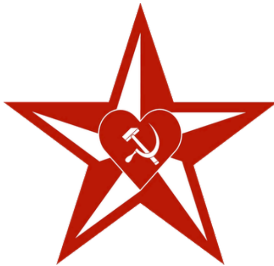
Blocul Electoral Patriotic al Socialiștilor, Comuniștilor, Inima și Viitorul Moldovei

La alianza se gestó en julio del 2025 con el objetivo de competir en las elecciones parlamentarias de septiembre. Se compone de cuatro partidos: el Partido de los Socialistas de la República de Moldavia, que aportó 52 de los 110 candidatos; el Partido de los Comunistas de la República de Moldavia, con 25 candidaturas; el Partido del Corazón Republicano de Moldavia, también con 25 candidatos; y finalmente el Partido del Futuro de Moldavia, con las 8 candidaturas restantes. Se presenta como un proyecto destinado a "unir la izquierda", y se compone de formaciones prorrusas y con una retórica anti-europeísta.