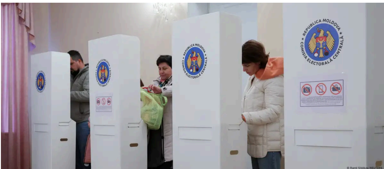
Un grupo de moldavos vota en las parlamentarias.

La gestión del proceso recayó en la Comisión Electoral Central, que fue responsable de administrar el Registro Centralizado de Votantes y de facilitar el voto a la diáspora. En este sentido, se abrieron 301 colegios electorales fuera del país, lo que subrayó la importancia de la población moldava en el extranjero para el resultado final de la elección.