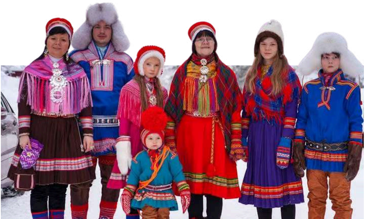
Comunidades indígenas Sami

Según Freedom House (2025), Noruega tiene una de las democracias más sólidas del mundo. Asimismo, es uno de los mejores países para vivir según el Índice de Desarrollo Humano (2023). Con una población de 5.6 millones de habitantes, de los cuales aproximadamente un 14% son inmigrantes, el país combina altos estándares de vida con una fuerte institucionalidad. No obstante, persisten tensiones con las comunidades indígenas Sami, especialmente en torno a proyectos de explotación productiva dentro de sus territorios. En cuanto a su sistema político, Noruega es una monarquía parlamentaria: el jefe de Estado es el rey Harald V desde 1991, mientras que el poder ejecutivo recae en el Consejo de Estado, integrado por el Primer Ministro y sus ministros designados.