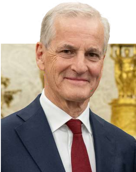
Jonas Gahr Støre

El Partido Laborista tiene una agenda centrada en el Estado de Bienestar, la reducción de la pobreza, la transición energética y la promoción de la paz y la democracia en el mundo. Noruega no es parte de la Unión Europea y por ende su eventual acceso es un tema de discusión política. De hecho, el Partido del Centro abandonó el gobierno por considerar que el país se había acercado demasiado al bloque regional. El Partido Laborista tiene una postura ambivalente respecto a este asunto. Si bien afirma estar a favor del ingreso de Noruega a la Unión Europea, confirmaron que no impulsarán esta política en caso de mantenerse en el gobierno.