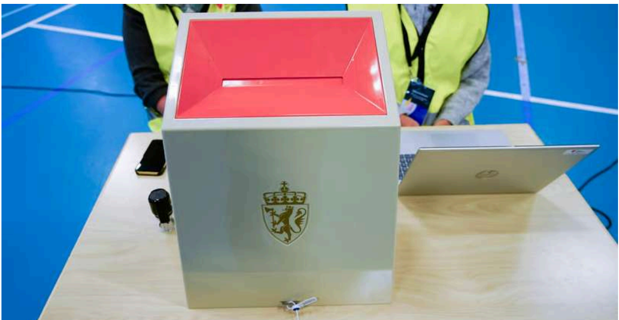
Urna electoral de las elecciones parlamentarias de Noruega 2025

Los partidos deben superar el 4% de los votos para competir por los llamados “escaños generales”, que son asignados a los partidos que hayan recibido una menor cantidad de diputados de los que les corresponderían en relación con el porcentaje obtenido a nivel nacional. Hay 150 bancas que se reparten proporcionalmente según la población censada en cada circunscripción y 19 escaños generales (uno para cada sección). Esto ayuda a evitar distorsiones en la manera en la que queda compuesta la Cámara.