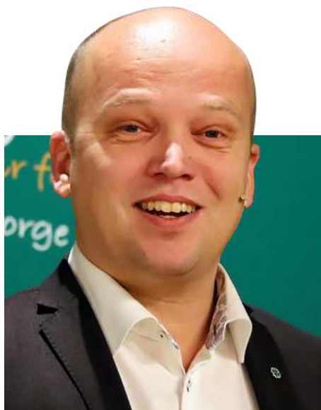
Trygve Slagsvold Vedum

consolidado su figura como defensor del campo y de las comunidades locales, proyectando la imagen de un político cercano a la gente común.