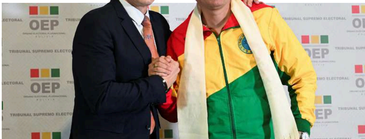
El candidato presidencial Rodrigo Paz y el postulante a vicepresidente Edman Lara, del Partido Demócrata Cristiano (PDC), estrechan sus manos durante una conferencia de prensa antes del debate presidencial previo a la segunda vuelta electoral, en La Paz, Bolivia, el 12 de octubre de 2025.

Por último, su mensaje hizo eje en la lucha contra la corrupción, con propuestas como la implementación de tecnología blockchain en los procesos de contratación pública para eliminar la discrecionalidad, promoviendo así un cambio estructural en la gestión de compras estatales. Asimismo, se comprometió con un saneamiento institucional y una mayor transparencia en la función pública.