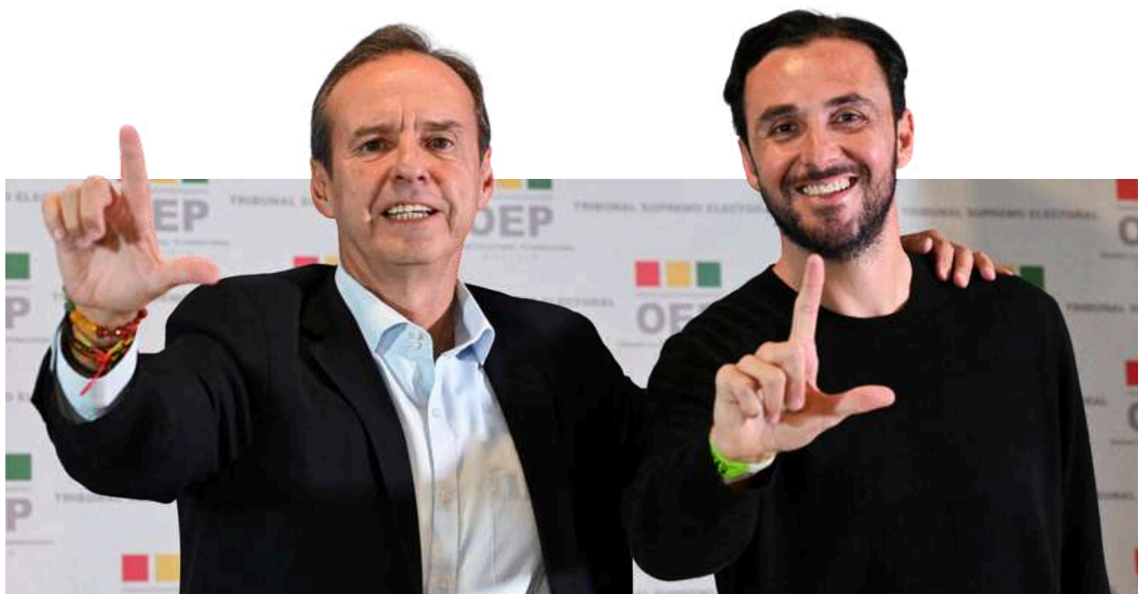
El candidato presidencial boliviano Jorge "Tuto" Quiroga y su compañero de fórmula Juan Pablo Velasco, de la coalición conservadora Alianza Libre, en La Paz, Bolivia, el 12 de octubre de 2025.