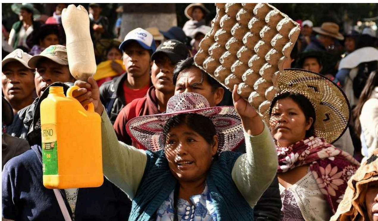
Personas protestando en Bolivia por la crisis política y económica

La elección de un nuevo presidente se dió en el marco de la peor crisis del país en décadas, marcada por una inflación anual de casi el 25%, el tercer valor más alto en América Latina detrás de Argentina y Venezuela, y una gran escasez de dólares, combustible y algunos productos importados. Sumado al casi agotamiento de los dólares de las reservas bolivianas para sostener una política universal de subsidios a los combustibles por parte del gobierno de Arce. Finalmente, la crisis económica se complementa con una crisis de representación, en la que las opciones electorales compiten sin estructura territorial y sin propuestas programáticas sólidas.