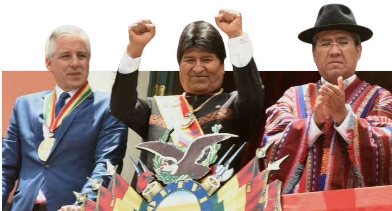
Evo Morales – Ex Presidente de Bolivia