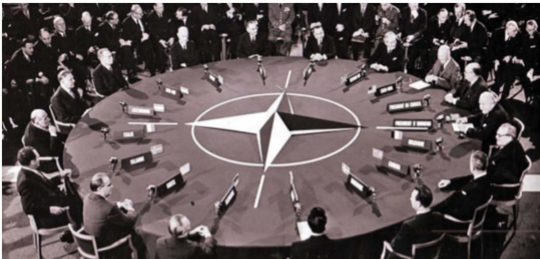
Primera cumbre de la OTAN, 4 abril de 1949

La Organización del Tratado del Atlántico Norte (OTAN), fue fundada el 4 de abril de 1949 con la firma del Tratado del Atlántico Norte en su preámbulo establece que: “Las partes firmantes del Tratado del Atlántico Norte, se comprometen promover la estabilidad y el bienestar en la zona del Atlántico Norte” (NATO, 1949).