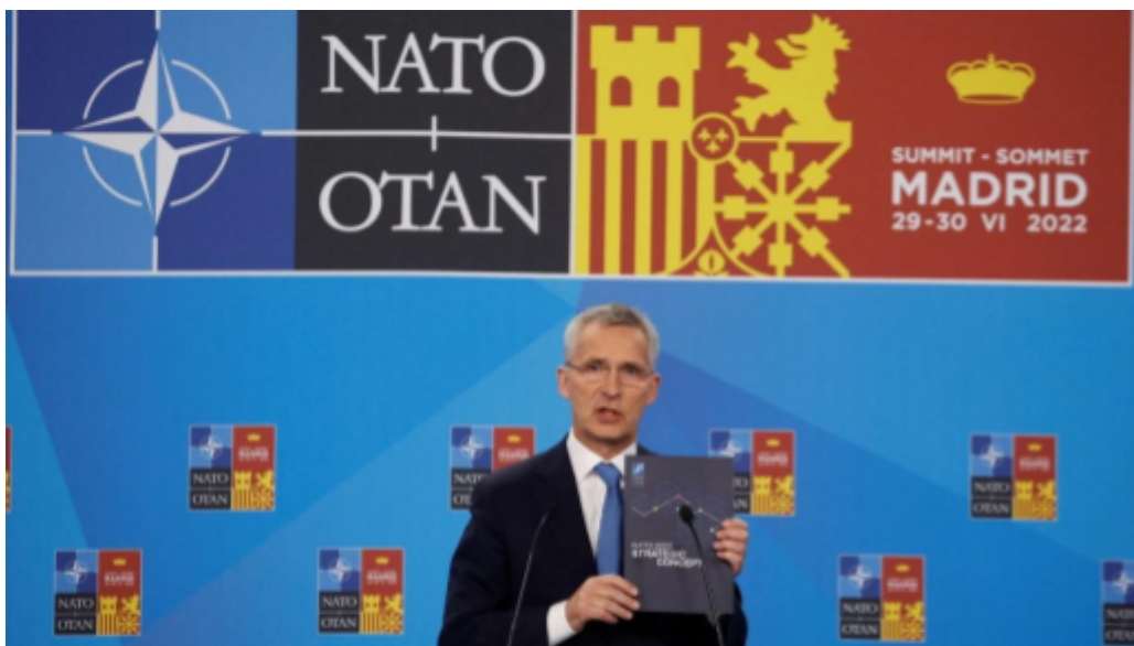
Presentación del The 2022 Strategic Concept por el Secretario General de la OTAN, Jens Stoltenberg

A la vez, el ingreso de nuevas naciones en la alianza se encuentra como uno de los puntos focales para contrarrestar el expansionismo de Rusia en Europa Oriental, principalmente en Ucrania y Georgia, lo que supondría una declaración de Guerra Fría algo que, por muchos años, especialistas y analistas discuten, es necesario apreciar cómo el comportamiento de la Rusia de Vladimir Putin, simboliza ser un frente de interés para la OTAN y la propia UE, pues preservar la seguridad e integridad en Europa es un objetivo común.