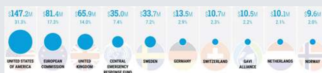
GRÁFICO 1. MAYORES DONADORES AL PLAN DE RESPUESTA. 24 DE JUNIO DEL 2024